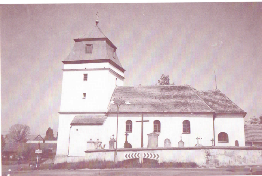
Libřický kostel, zasvěcený sv. Michaelovi