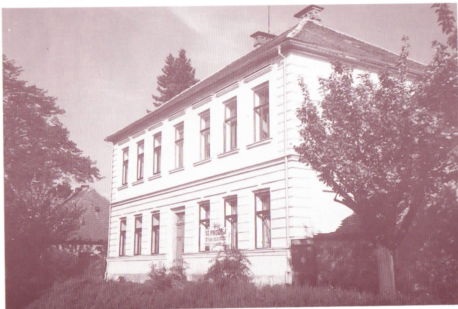
Budova bývalé školy

XXXXXXXXXXXXXXXXXXXXXXXXXXXXXXXXXXXXXXXXXXXXXXXXXXXXXXXXXXXX