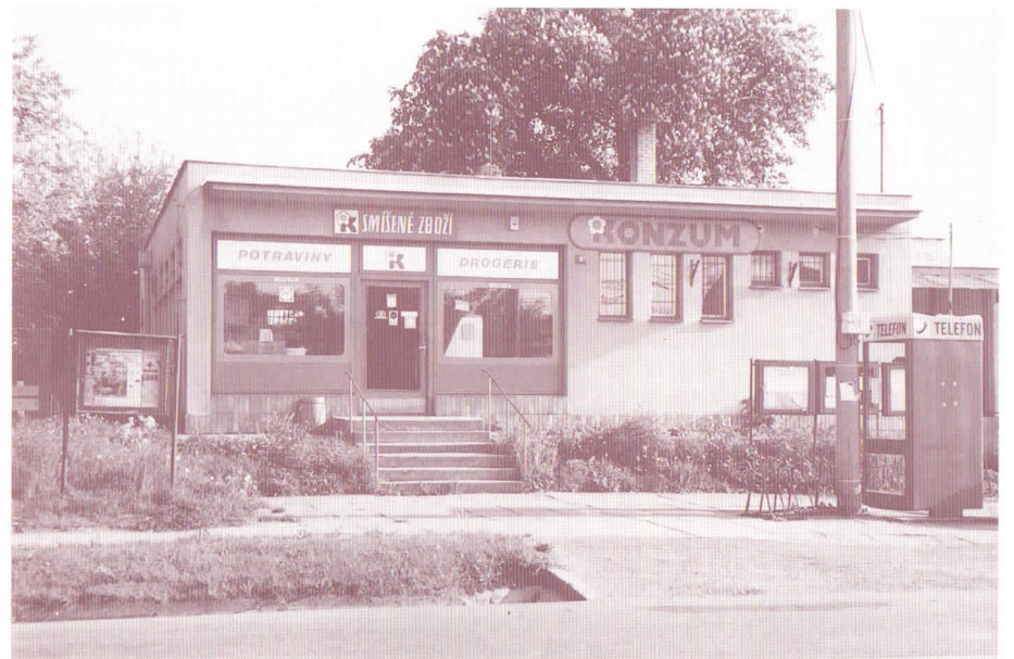
Místní prodejna smíšeného zboží