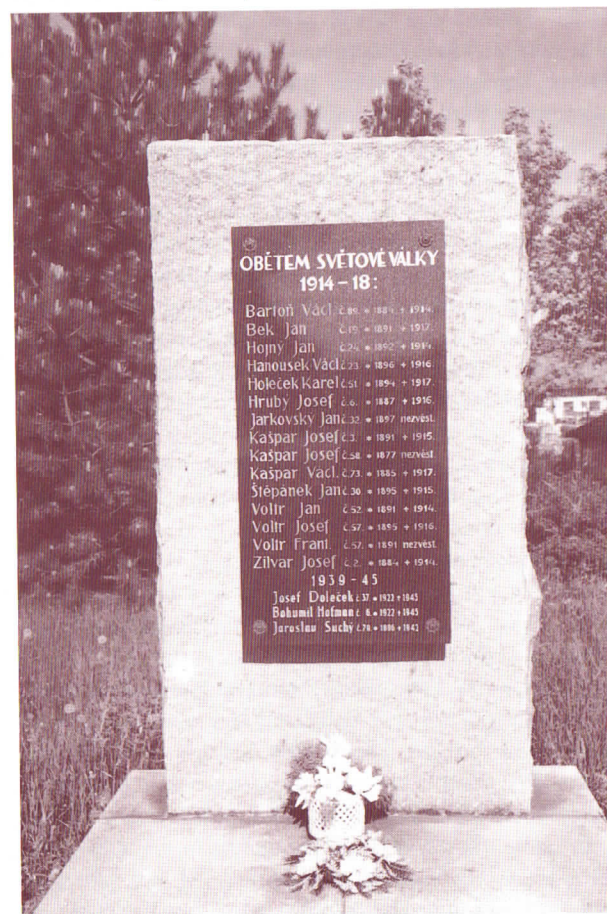
Pamětní deska padlým v 1. a 2. svět.válce

Zápis kronikáře z roku 1912 praví: „ 19. července, o půl čtvrté odpoledne, hořela u Špatenků v čp. 1. pod kůlnou fůra sena. Štěstí bylo, že přítomní hosté zavčas fůru vytáhli doprostřed dvora a oheň ulili.“