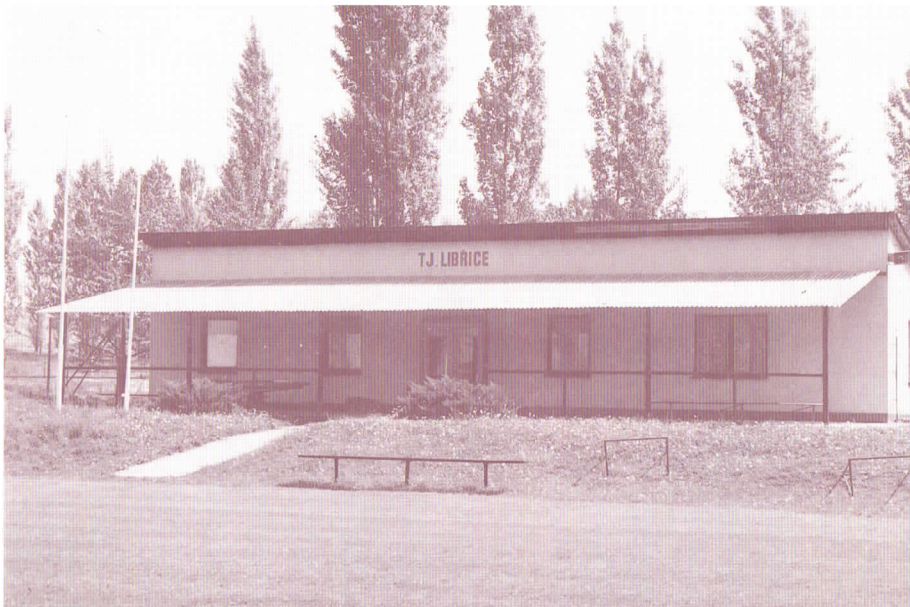
Budova libřických sportovců a fotbalového hřiště