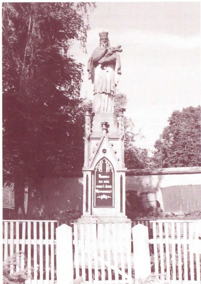
Jedna z kulturněhistorických památek obce. Socha sv. Jana v sousedství kostela.